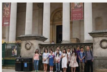
剑桥菲茨威廉博物馆