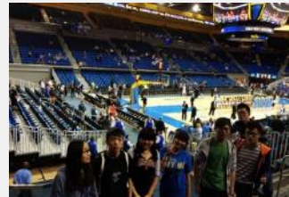
观看 UCLA 篮球赛

在课余时间，学员将有机会充分探索洛杉矶魅力：好莱坞、贝弗利山、圣塔莫妮卡海滩... 沉浸在美国加州神韵同时，提升跨文化沟通技能。