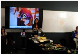
和 UCLA 学生交流