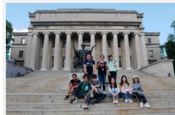
哥伦比亚大学参访